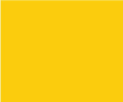
Tangerine Yellow #FFCC05